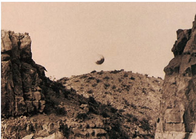
Ein Student nahm dieses Foto 1967 im US-Bundesstaat New Mexico auf. Angeblich machte das Ufo keinerlei Geräusch und verschwand blitzschnell wieder.

erzählten, sie seien gefangen genommen worden und an Bord von Ufos seltsamen Operationen unterzogen worden. Freilich konnte noch niemand Spuren dieser Behandlung nachweisen, obwohl darauf hohe Belohnungen ausgesetzt sind.