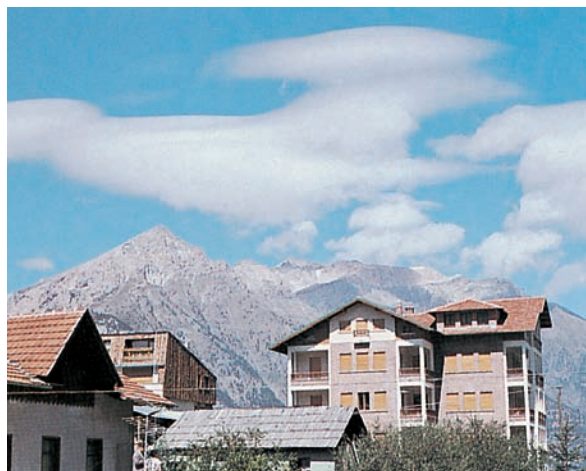
Nicht selten nehmen Wolken im Wind ovale Formen an und ähneln dann einer von der Seite gesehenen „fliegenden Untertasse“.