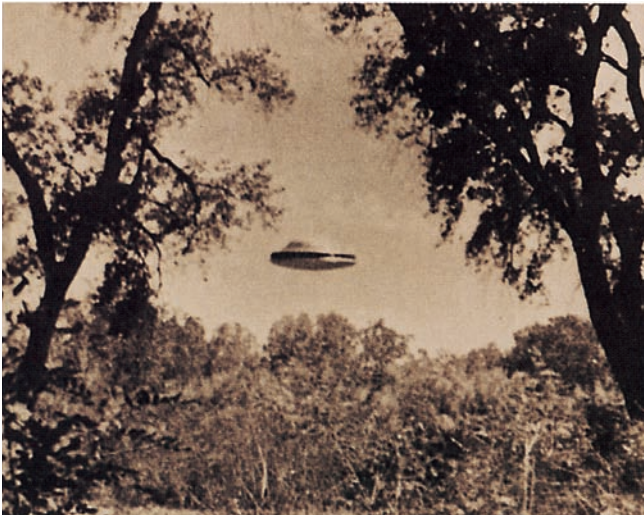
Auch dieses angebliche Ufo-Foto entstand in New Mexico (USA). Leider zeigt das seltsame Objekt in der Bildmitte nicht viele Einzelheiten ...