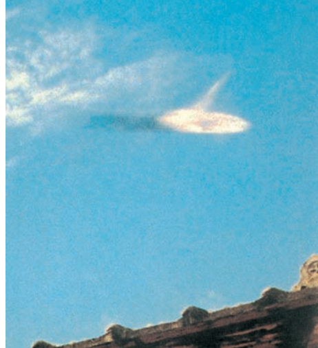
Dieses „Ufo“, vermutlich einfach eine ovale Wolke, tauchte angeblich 1995 über dem Dach eines Bauernhauses in Südkorea auf.

um Höhe zu gewinnen und die Maschine nicht am Boden zerschellen zu lassen. Das war eine instinktive Reaktion, an die er sich aber hinterher nicht mehr erinnerte. Auch schwebte der Meteorit natürlich nicht am Himmel. Aber durch die Steuerknüppel-Bewegung drehte sich der Hubschrauber so, dass der Feuerball scheinbar stehen blieb. Das Ganze lief innerhalb einer Sekunde ab, nur den Insassen kam die Zeitspanne viel länger vor. Und das grüne Licht? Das rührte von der grünen Sonnenschutzfolie oben am Hubschrauberfenster her: Durch die Drehung wendete die Maschine einen Augenblick lang ihr Oberteil dem Meteoriten zu, sodass sein Licht durch die grüne Folie hindurch in die Kabine fiel.