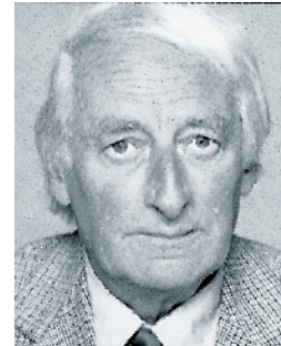
Prof. Dr. Heinz Haber