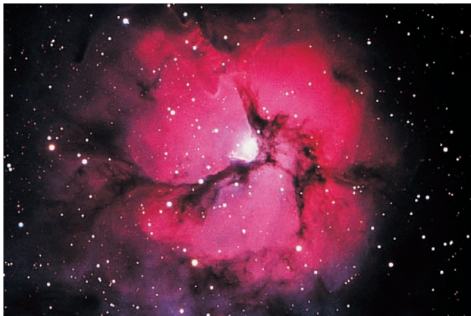
Trifidnebel im Sternbild Schütze