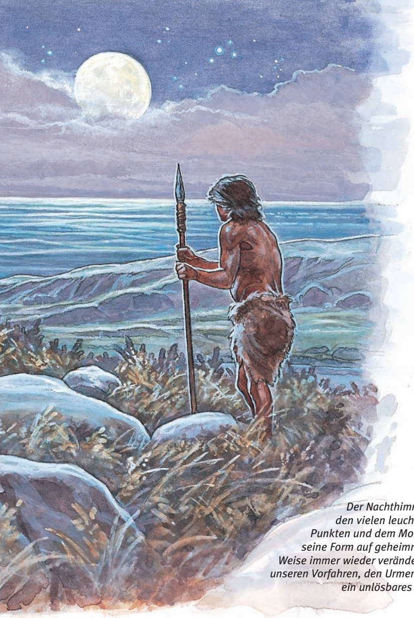
Der Nachthimmel mit den vielen leuchtenden Punkten und dem Mond, der seine Form auf geheimnisvolle Weise immer wieder verändert, war unseren Vorfahren, den Urmenschen, ein unlösbares Rätsel.