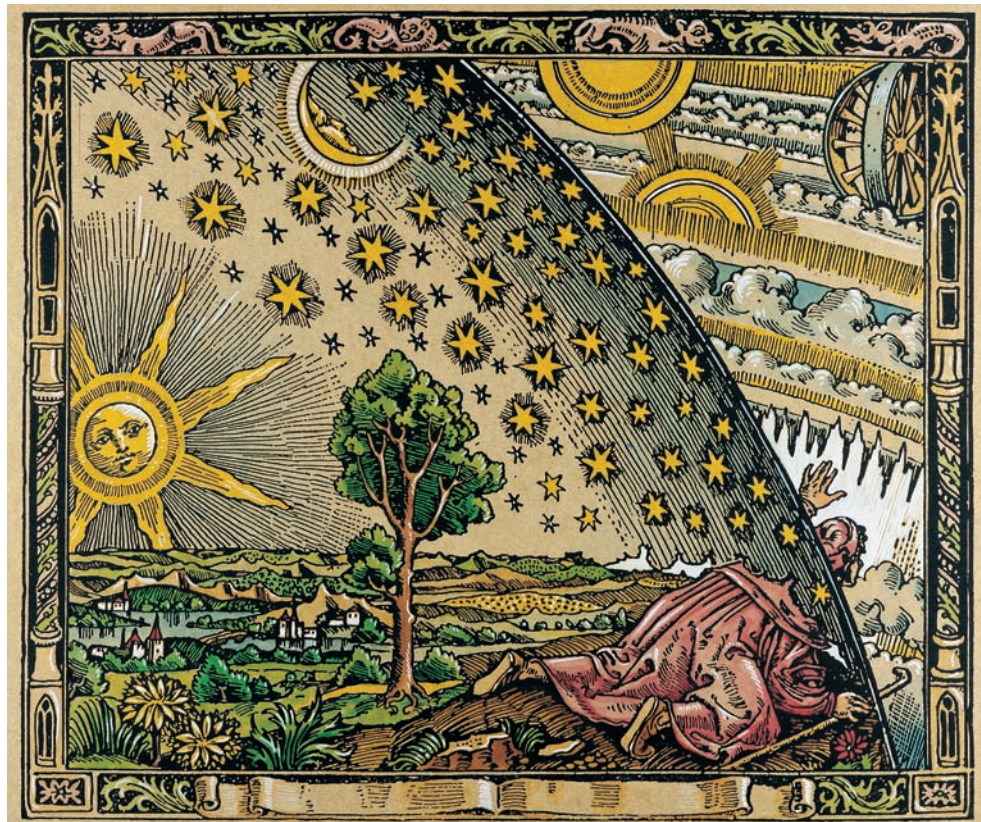
So stellten sich noch vor wenigen Jahrhunderten viele Menschen den Sternhimmel vor: Die Sterne sind am Himmelszelt befestigt und drehen sich mit diesem um die Erde, die im Mittelpunkt des Weltalls steht. Auf dem Holzschnitt rechts steckt ein Neugieriger seinen Kopf durch die Kuppel, um zu sehen, welche Apparaturen das Himmelszelt um die Erde bewegen.

Schon der griechische Philosoph Plato (427–347 v. Chr.) hatte erkannt, dass es falsch war, sich die Erde als Mittelpunkt der Welt vorzustellen, und der Astronom Aristarchos von Samos (310–230 v. Chr.) hatte gelehrt, dass die Sterne nur scheinbar um die Erde kreisen – es sei die Erde, die sich um ihre Achse