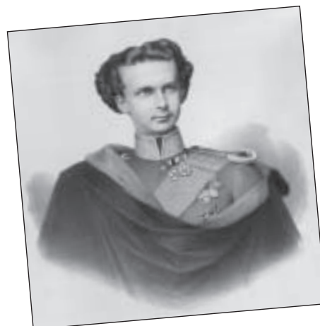
Ludwig II. – von 1864 bis 1886 König von Bayern